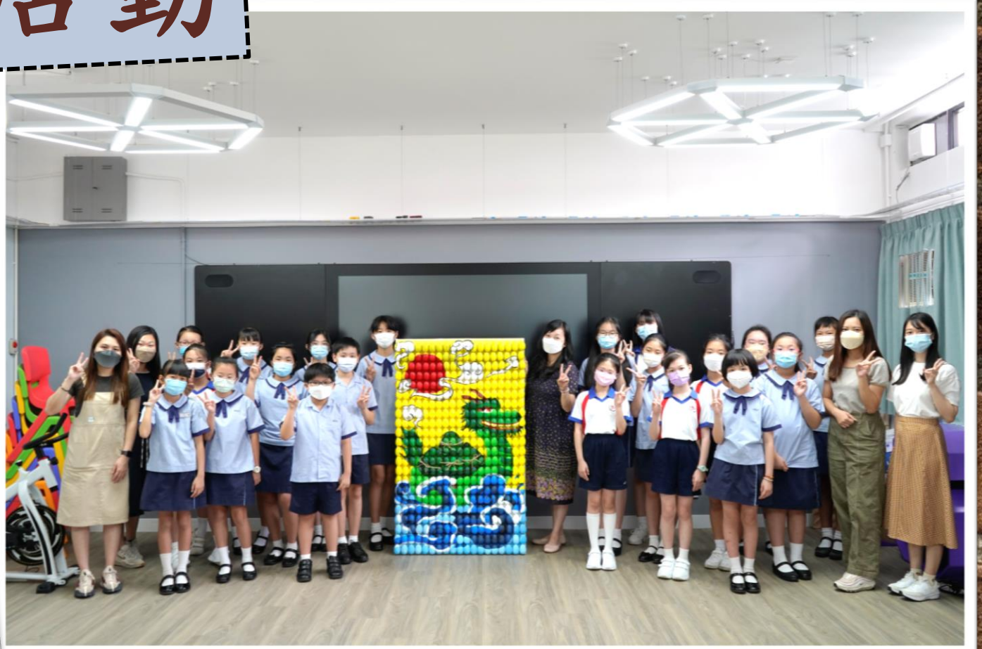
獲獎學生與王校長、老師們於作品前合照