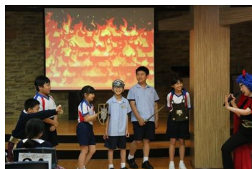
福音話劇-《屠龍六勇士》