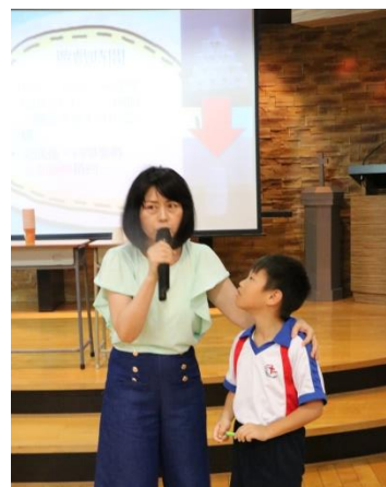
品德教育講座-《逆境不倒翁》