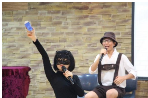
福音話劇-《神奇擦膠》